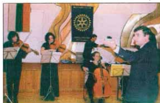
Вицепрезидентът Симеонов дирижира