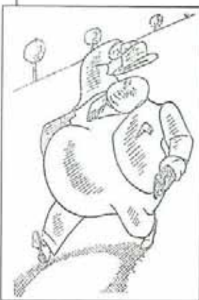
Портретна карикатура на инж. Любен Божков - първия дистрикт гуверньор на България (сп. „Ротари клуб - София“, бр. 15/34 г., Ал. Добринов)

Н а 22.12.1998 г. в Софийската градска галерия бе открита юбилейна изложба „100 години от рождението на Ал. Добринов“*. Един от спомоществователите за организиране на изложбата е Ротари клуб - София. Името на Добринов е тясно свързано с историята на първия софийски клуб. През 1934 година по покана на неговия приятел от „чехословашките години“ Цвятко Кагийски Добринов става постоянен гост на сбирките на клуба. В продължение на 3 години (до заминаването си в Полша) художникът създава повече от