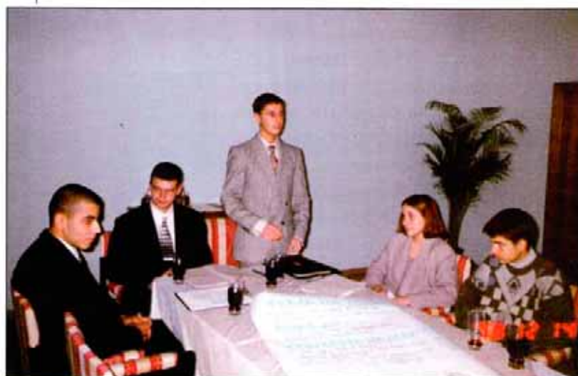
Младите участници в дебата

След като изслушахме изключително добре аргументираната теза на учениците: „да служиш безкористно на обществото чрез Ротари е утопия“, разбрахме две неща: първо, че срещу себе си имаме добре подготвен опонент, познаващ техниките на спора, и второ, че на изпитание бяхме поставили не само способността си да защитим, да докажем верността към идеала, който обединява ротарианците по света. Бързо стана ясно, че в този дебат трябва да покажем и умение да атакуваме мислите, а не мислителите; да изпробваме толерантността си